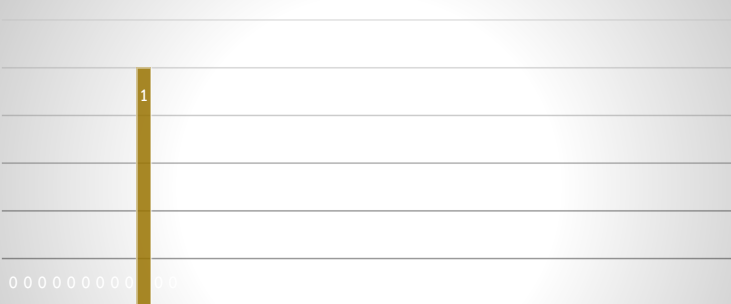
การให้บริการน้ำดื่ม