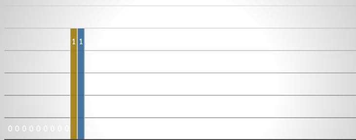
การส่งเสริมสุขภาพอนามัย