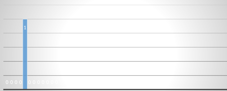
การบริการอาคารประกอบ